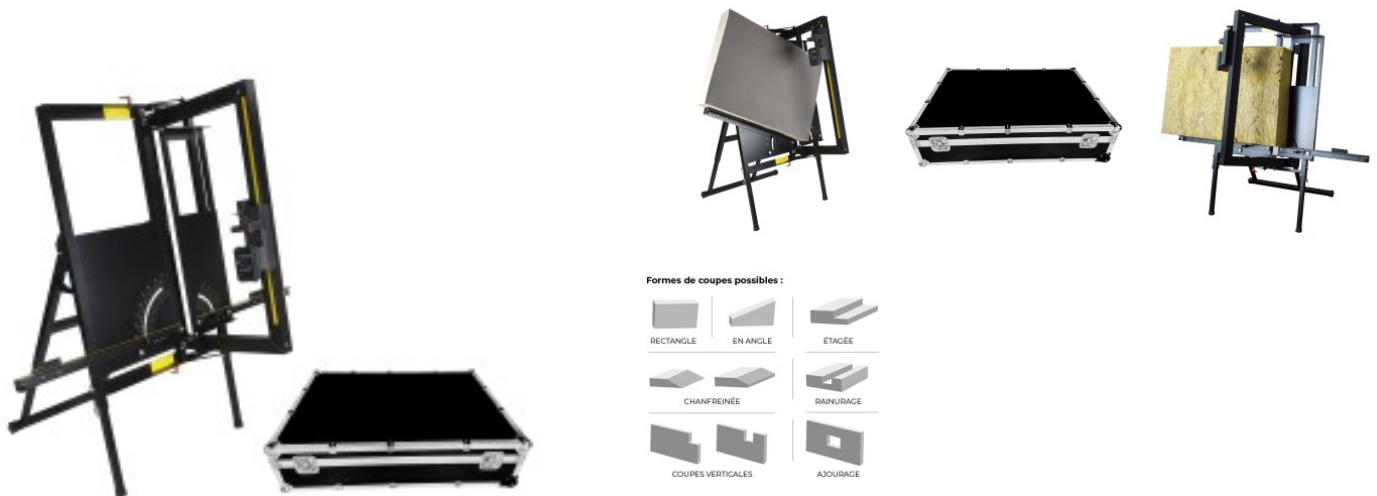
Formes de coupes possibles :