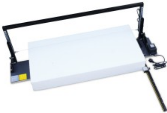
TABLE DE DÉCOUPE AU FIL CHAUD HORIZONTALE - Pour polystyrène

Réf. : 260155 Gencod 3476062601559 UPC: 1