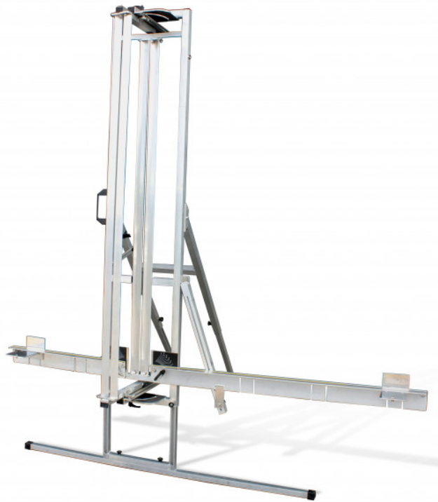
TABLE DE DÉCOUPE POUR ISOLANT MINÉRAL

Réf. : 366955 Gencod 3476060036698 UPC: -