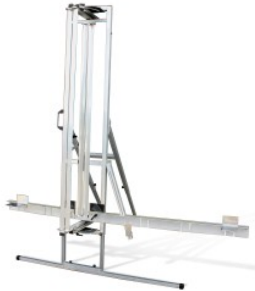
TABLE DE DÉCOUPE POUR ISOLANT MINÉRAL

Réf. : 366955 Gencod 3476060036698 UPC: -