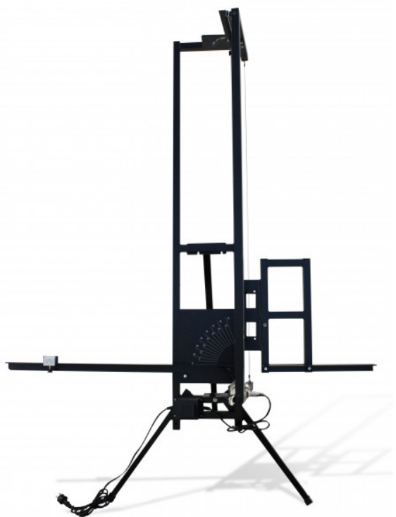
TABLE DE DÉCOUPE AU FIL CHAUD - Pour polystyrène, spécial I.T.E.

Réf. : 266555 Gencod 3476060026651 UPC: 1