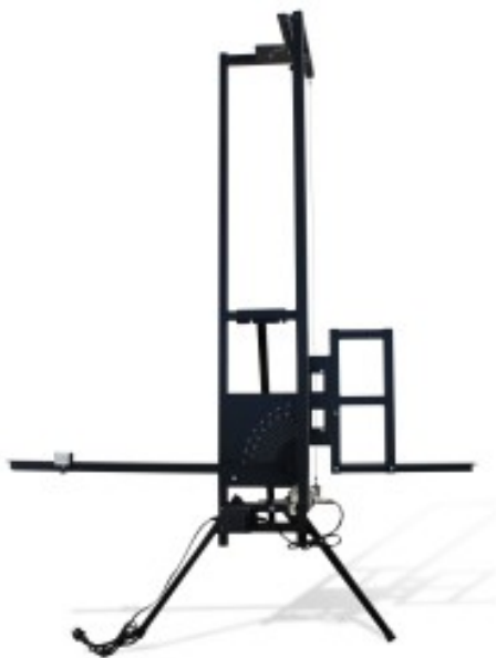
TABLE DE DÉCOUPE AU FIL CHAUD - Pour polystyrène, spécial I.T.E.

Réf. : 266555 Gencod 3476060026651 UPC: 1